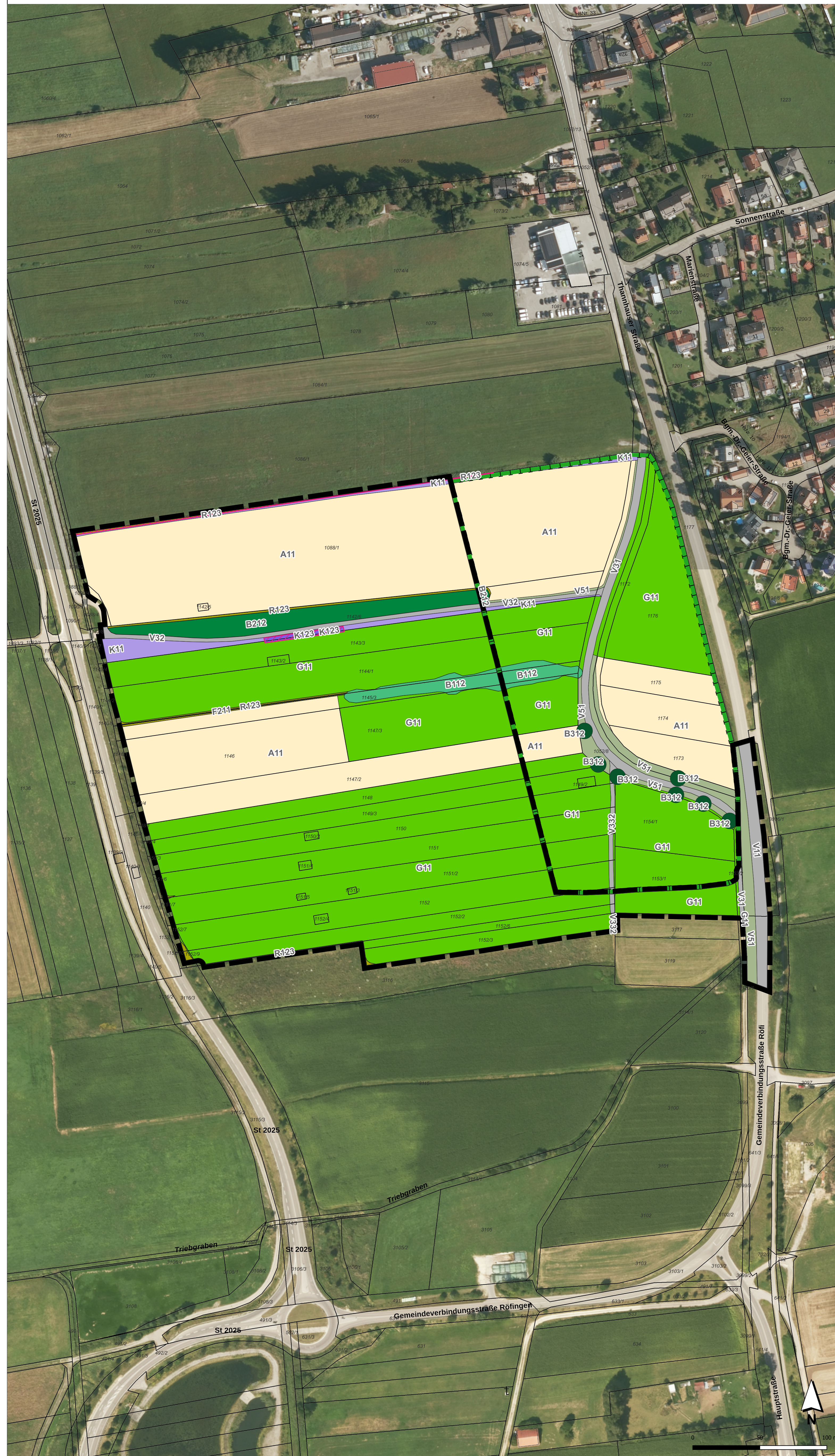
Bestandsplan Vorhaben und potentielle Ausgleichsfläche M 1:1500