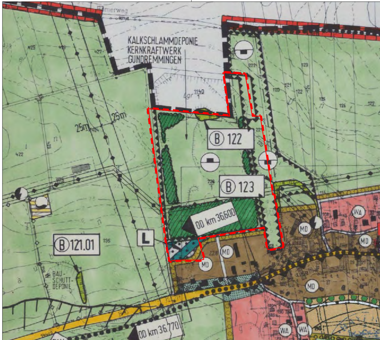
Flächennutzungsplan, rechtswirksame Fassung, M 1: 5.000