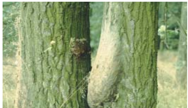
Gespinnstnest an Eiche

Die Haare haben Widerhaken, sind hohl und enthalten als Brennschubstanz das lösliche Eiweiß Thaumetopein. Ihre Reizwirkung an Hautstellen und an den Schleimhäuten ist mechanisch, da sie in die Haut eindringen. Zudem wirkt das freigesetzte giftige Protein biochemisch. Besonders betroffen sind dünne Hautpartien im Gesicht, am Hals und an der Innenseite der Ellenbogen.