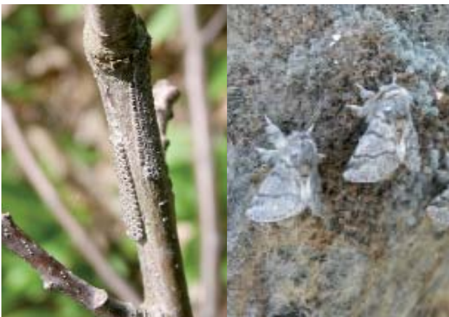
Eigelege und frisch geschlüpfte Falter des Eichenprozessionsspinners

Der unscheinbare, in den Nachtstunden schwärmende Falter fliegt Ende Juli bis Anfang September. Er erreicht eine Flügelspannweite von 25 mm. Seine Vorderflügel sind grau mit schwach ausgeprägten dunklen Querlinien, die Hinterflügel sind weissgrau.