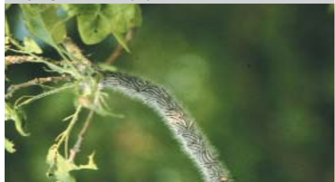
Jungraupen beim Blattfraß

wobei oft die Mittelrippe zurück bleibt. Von Beginn an leben sie in geselligen Familienverbänden und sammeln sich nestartig an locker zusammengesponnenen Blättern oder Zweigen. Mitte Juni ziehen sich die älteren Raupen tagsüber und zur Häutung in typische, mit Kot und alten Larvenhäuten gefüllte Gespinnstester am Stamm und in Astgabelungen zurück. Diese sind bis zu einem Meter lang. Von dort aus begeben sich die Raupen wie in einer Prozession auf Nahrungssuche. 20 bis 30 ältere Tiere können dabei nebeneinander her wandern und Bänder von mehr als 10 m Länge bilden. Die Verpuppung erfolgt Ende Juni/Anfang Juli in dicht aneinandergedrängten Kokons im Gespinnstest. Die Puppenruhe dauert drei bis fünf Wochen. Die Nester können mehrere Jahre als feste Gebilde aus Spinnfäden, Raupenkot, Häutungsresten und Puppenhüllen erhalten bleiben. Die Gefahr allergischer Reaktionen bleibt dabei weiter bestehen.