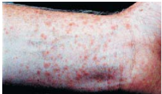
Durch Gifthaare verursachte Hautreaktionen

Bei Auftreten von allergischen Symptomen sollte der behandelnde Arzt oder Hautarzt aufgesucht werden. Der Patient sollte dabei von sich aus auf den Kontakt mit den Raupenhaaren hinweisen.