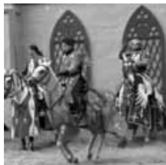
Schloss Thurn Erlebnispark treffpunktdeutschland.de/heroldsbach