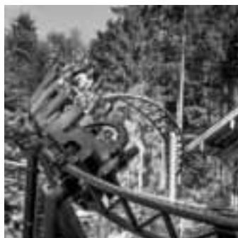
Freizeitpark Ruhpolding treffpunktdeutschland.de/ruhpolding