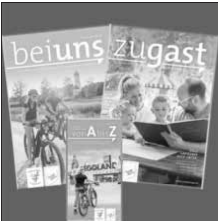
Das Urlaubs- und Freizeitmagazin „Bei uns“, das Gastgeberverzeichnis „Zu Gast“ und der Reiseführer „A-Z“ sind wertvolle Informationsquellen für Touristen aber auch für hiesige Interessierte.

Das aktuelle Prospektmaterial steht auf www.familien-und-kinderregion.de zum Download und zur Bestellung zur Verfügung und liegt an den Infopoints (Übersicht auf www.familien-und-kinderregion.de/touristinfo ) sowie im Büro der Regionalmarketing Günzburg GbR bereit.